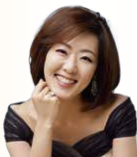
三宅理恵(ソプラノ)