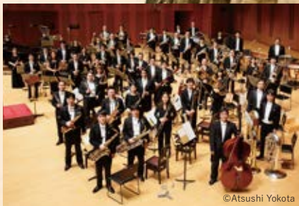
演奏: 東京佼成ウインドオーケストラ Tokyo Kosei Wind Orchestra